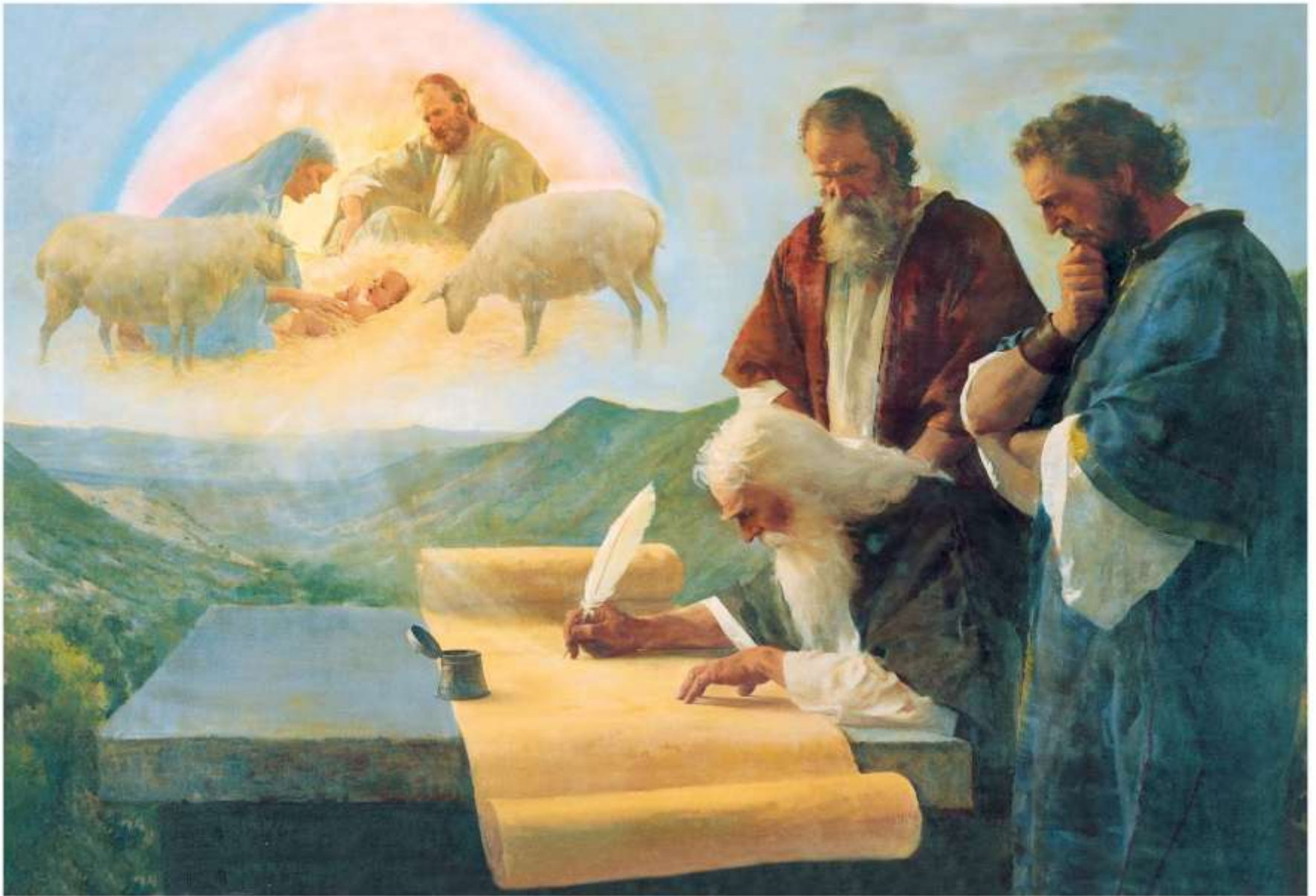
The Prophet Isaiah Foretells Christ's Birth, by Harry Anderson, © 1911

Alla jinqeda bil-Profeti biex iwasslilhom il-Kelma tiegħu. Il-poplu Lhudi mhux dejjem jisma' u jobdi lil Alla.